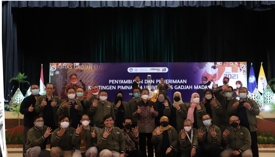
Juara Pimnas. Kontingen UGM sukses mempertahankan gelar Juara Umum di Pekan Ilmiah Mahasiswa Nasional (PIMNAS) ke-34 yang berlangsung di Universitas Sumatera Utara (USU) pada 25-29 Oktober 2021. Prestasi tersebut menjadikan UGM sebagai juara bertahan PIMNAS selama empat tahun berturut-turut sejak tahun 2018 lalu.