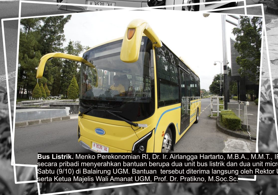
Bus Listrik. Menko Perekonomian RI, Dr. Ir. Airlangga Hartarto, M.B.A., M.M.T., IPU., secara pribadi menyerahkan bantuan berupa dua unit bus listrik dan dua unit microbus, Sabtu (9/10) di Balairung UGM. Bantuan tersebut diterima langsung oleh Rektor UGM serta Ketua Majelis Wali Amanat UGM, Prof. Dr. Pratikno, M.Soc.Sc.