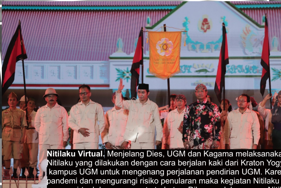
Nitilaku Virtual. Menjelang Dies, UGM dan Kagama melaksanakan kegiatan Nitilaku yang dilakukan dengan cara berjalan kaki dari Kraton Yogyakarta menuju kampus UGM untuk mengenang perjalanan pendirian UGM. Karena alasan pandemi dan mengurangi risiko penularan maka kegiatan Nitilaku hanya dilakukan secara virtual dengan peserta terbatas. Dikemas dalam acara Nitilaku Virtual Journey yang berlangsung di Grha Sabha Pramana UGM, Sabtu (18/12), alumni Gelanggang mempersembahkan pertunjukan drama operet sejarah pendirian kampus UGM.